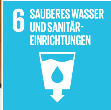
Weltwassertag 2023 – Informations- und Mitmachstand des Naturschutzzentrums